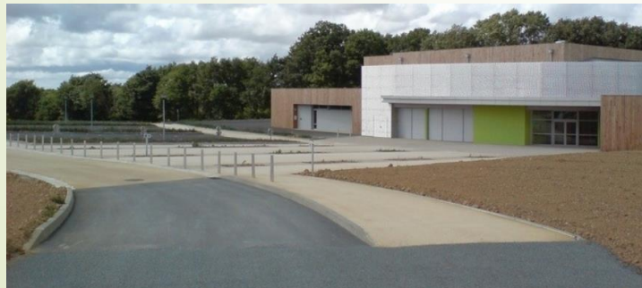
Travaux de voirie